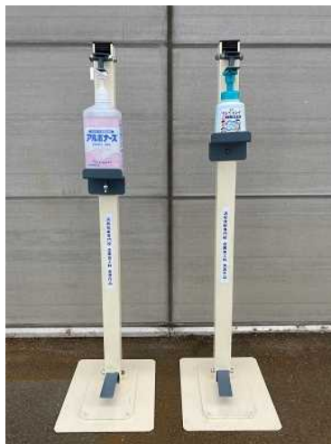
【実習課題（予定）】 足踏み式消毒スタンド