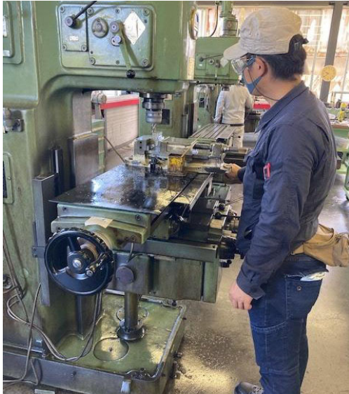
旋盤、フライス盤の基礎技能を習得