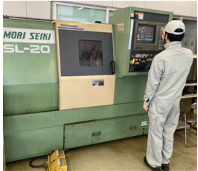
マシニングセンタ、NC 旋盤の技能を習得