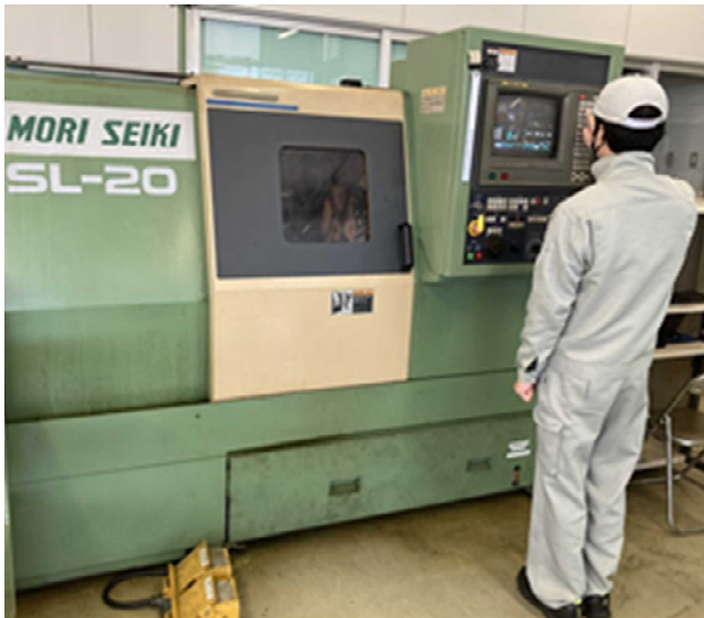
マシニングセンタ、NC 旋盤の技能を習得