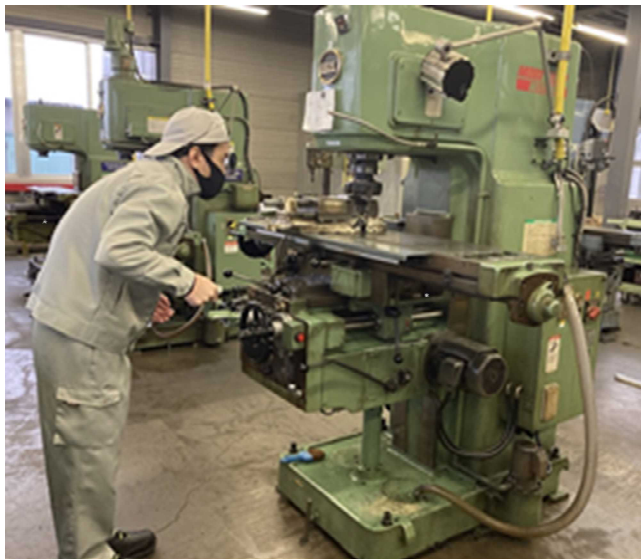
旋盤、フライス盤の基礎技能を習得