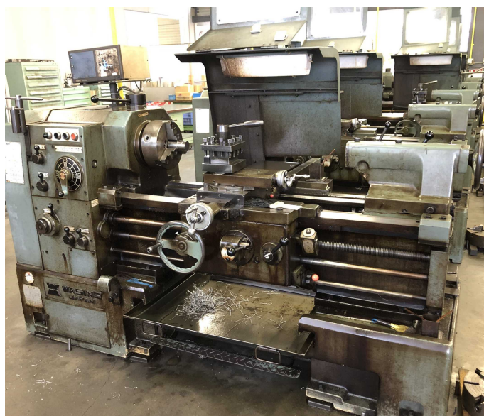
旋盤、フライス盤の基礎技能を習得