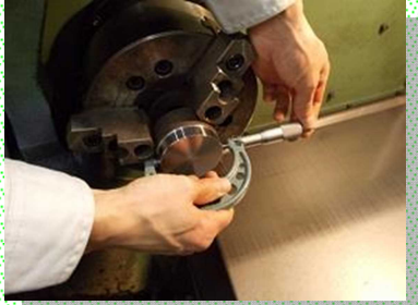
各種測定器の取り扱い練習

金属加工分野への早期就職のため、切削加工と溶接加工の基礎技能が習得でき、関係する各種資格の取得も可能です。