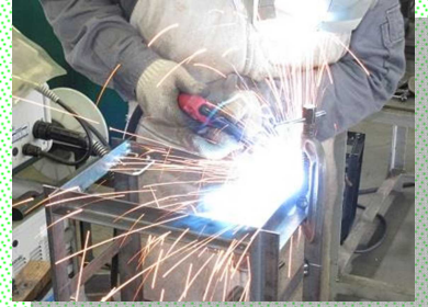
半自動溶接機の溶接技能を習得