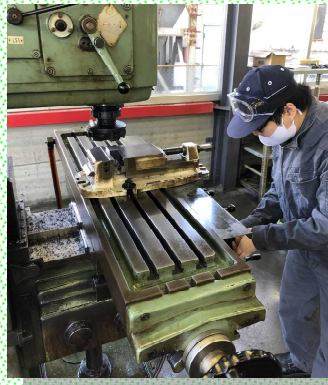
フライス盤の加工技能を習得