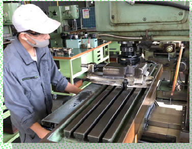
フライス盤の加工技能を習得