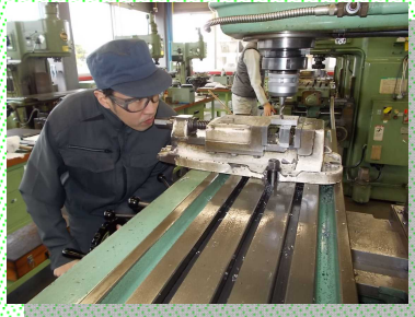
フライス盤の加工技能を習得