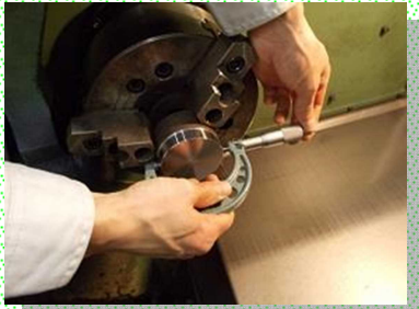
各種測定器の取り扱い練習

金属加工分野への早期就職のため、切削加工と溶接加工の基礎技能が習得でき、関係する各種資格の取得も可能です。