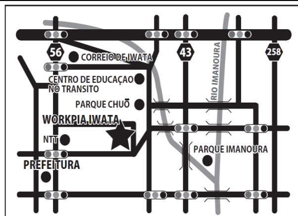
Local do Treinamento 26/12/2017 (terça)

Colégio Técnico de Hamamatsu Hamamatsu-shi Higashi-ku Koike-cho 2444-1 Trem: Linha Enshu (Trem vermelho) Da Estação Shin Hamamatsu , descer na estação Jidousha Gakkou mae, 15 minutos caminhando. Ônibus: da Estação de Hamamatsu plataforma 10 ônibus No74 ou 77 descer no Shopping Center Aeon de Itino, 3 min caminhando em frente ao Family Mart. (Estacionamento Gratuito)