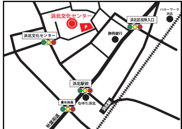
「訓練実施会場」案内図

〒435-0056 浜松市東区小池町 2444-1 ☎053-462-5602 電車：遠鉄電車「自動車学校前」駅から、徒歩約15分 車：JR浜松駅から約20分、 東名高速道路「浜松インター」から約15分