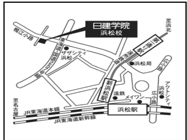
「訓練実施会場」案内図