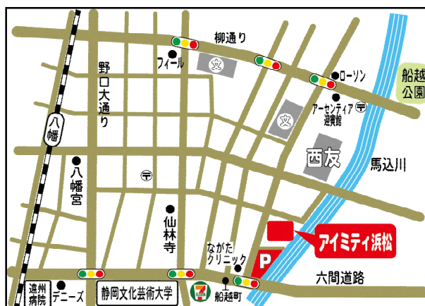
「訓練実施会場」案内図