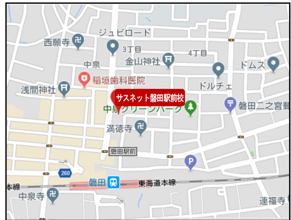
「訓練実施会場」案内図