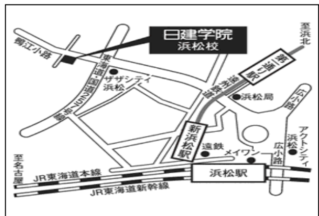
「訓練実施会場」案内図