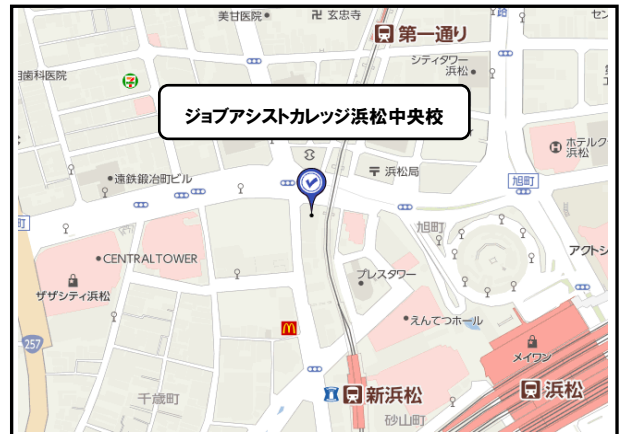
「訓練実施会場」案内図