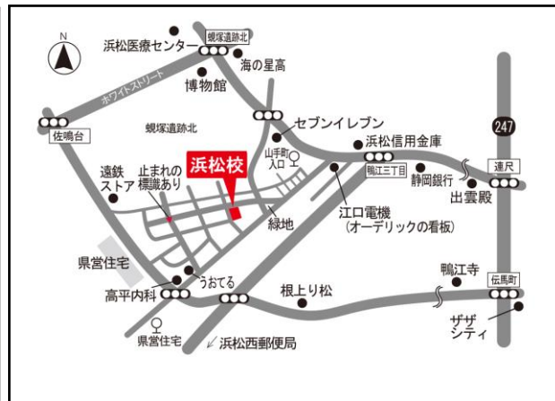
「訓練実施会場」案内図

電車：遠鉄電車「自動車学校前」駅下車、徒歩約 15 分 車：JR 浜松駅から約 20 分、 東名高速道路「浜松インター」から約 15 分