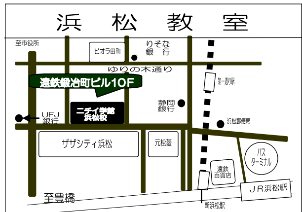
「訓練実施会場」案内図

電車：遠鉄電車「自動車の学校前」駅下車、徒歩約 15 分 車：JR 浜松駅から約 20 分、 東名高速道路「浜松インター」から約 15 分