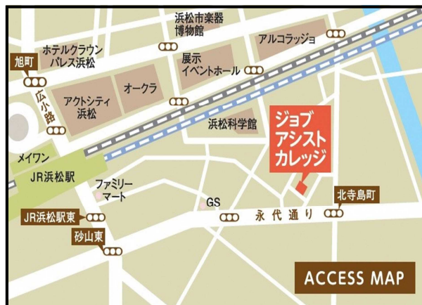
「訓練実施会場」案内図