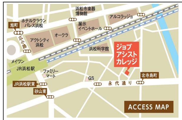
「訓練実施会場」案内図