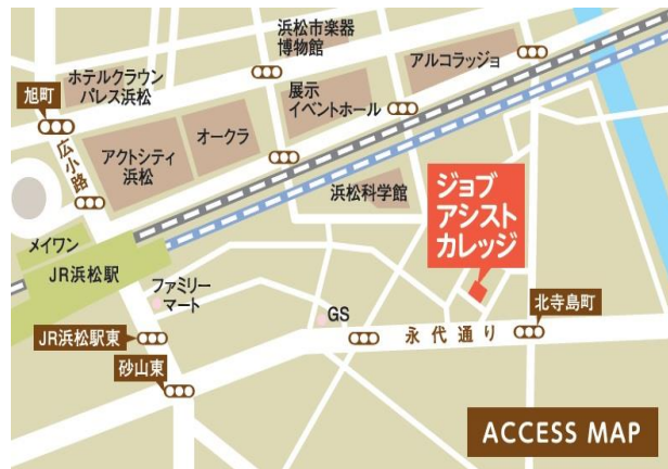
「訓練実施会場」案内図