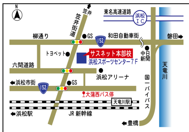
「訓練実施会場」案内図

電車：遠鉄電車「自動車学校前」駅下車、徒歩約15分 車：JR浜松駅から約20分、 東名高速道路「浜松インター」から約15分