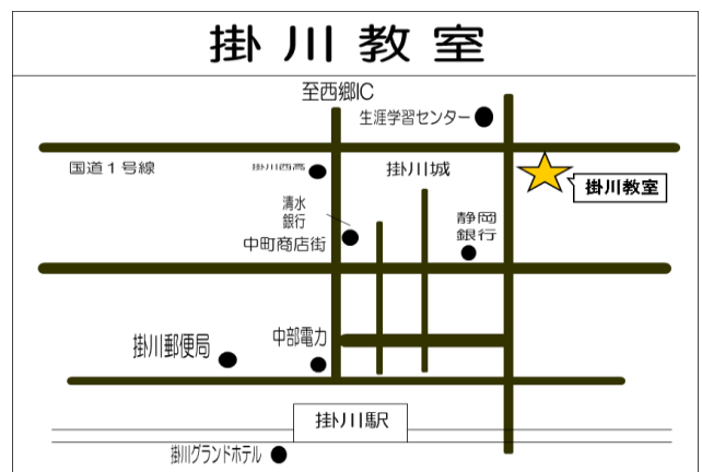
「訓練実施会場」案内図

電車：遠鉄電車「自動車学校前」駅から、徒歩約15分 車：JR浜松駅から約20分、 東名高速道路「浜松インター」から約15分