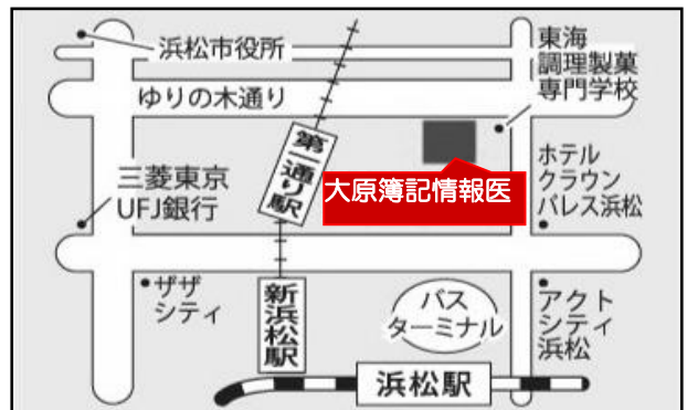
「くんれんじしきかいじょう」あんないず 「訓練実施会場」案内図

でんしゃ えんてつでんしや じどうしゃがっこうまえ えき とほ やく ぶん 電車: 遠鉄電車「自動車学校前」駅から、徒歩約15分 くるま はまつえき やく ぶん 車: JR浜松駅から約20分、 とうめいこうそくどうろ はまつ 東名高速道路「浜松インター」から約15分