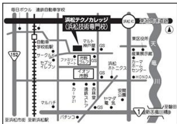
「入校選考会場」案内図