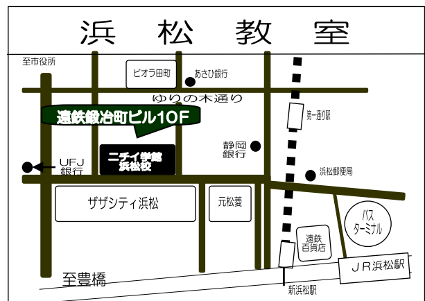
「訓練実施会場」案内図

電車：遠鉄電車「自動車学校前」駅から、徒歩約 15 分 車：JR 浜松駅から約 20 分、 東名高速道路「浜松インター」から約 15 分