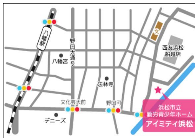
「訓練実施会場」案内図

浜松技術専門学校(浜松テクノカレッジ)(自家用車可) 〒435-0056 浜松市東区小池町 2444-1 ☎053-462-5602 電車：遠鉄電車「自動車学校前」駅から、徒歩約 15 分 車：JR 浜松駅から約 20 分、 東名高速道路「浜松インター」から約 15 分